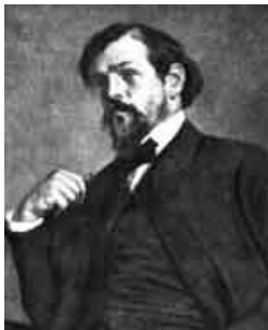
d'après le portrait de Jacques-Émile Blanche 1905

La musique de Debussy est aux antipodes du post-romantisme et du wagnérisme alors en vogue en Europe. Le développement traditionnel est abandonné, les thèmes fragmentés. La couleur et la sensation prédominent (souvent violentes : rien de plus faux que l'idée d'un Debussy flou ou vague ; son dessin est toujours net et sa musique puissamment sensuelle), la dissonance s'émancipe. L'influence des traditions exotiques (gamme pentatonique, gamme par tons entiers...) est considérable. Enfin, dans cette oeuvre exigeante, si l'expérimentation prime, le résultat n'est jamais inférieur à la pensée ; harmoniste extraordinaire, excellent pianiste, orchestrateur d'exception, Debussy était aussi un artisan de la création musicale au sens fort du terme. Avant Stravinski et Bartok, il est l'un des grands émancipateurs de la musique occidentale.